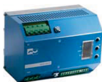
Sistemi integrati Soft Starters/ Schede di frenatura (1,5 - 15 KW)

Omologazione secondo le più recenti normative europee sulla sicurezza