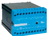
Schede di frenatura (1,5 - 160 KW)